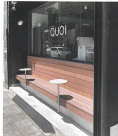
船場地区にある 既存の「まちのコシカケ」の例