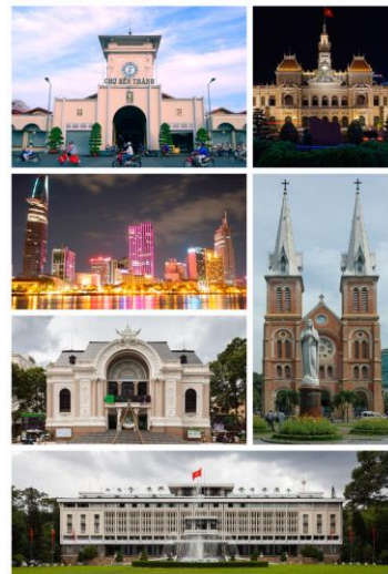
ホーチミンの様子