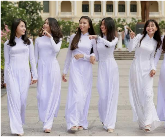
ベトナムの伝統的な服装はアオザイです