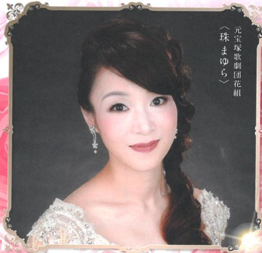
元宝塚歌劇団花組 （珠まゆら）