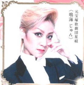
元宝塚歌劇団星組 （鳴海じゅん）