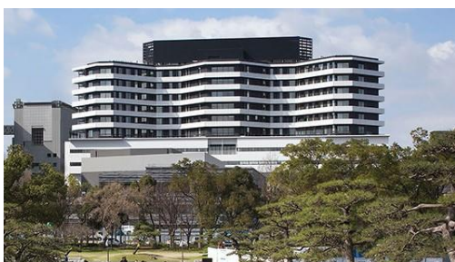
〈大阪国際がんセンター(手前は重粒子線センター)〉

検査や入院中に意外だったのはお客様や知り合いによく会うことで、お互いに苦笑いしながら同病相憐れんでおりました。